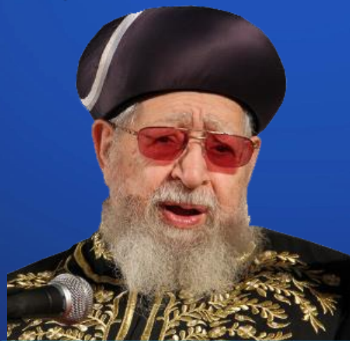
מרן הרב עובדיה